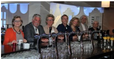
Gastvrouwen en -heren van De Lange Tafel

Beste mensen soms zijn er zaken waar je ineens alleen voor komt te staan en dan zijn er toch lichtpuntjes om wel iets te ondernemen. Zo vertelde Riny Over de Lange Tafel in het Parktheater.