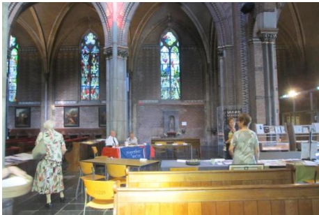
Voorbereiding voor de Ontmoetingsmarkt

Bij de start van de herfst in de jubileummaand van de Cathrien valt er veel te melden.